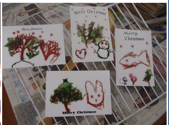
1週間後に届くのが楽しみ～