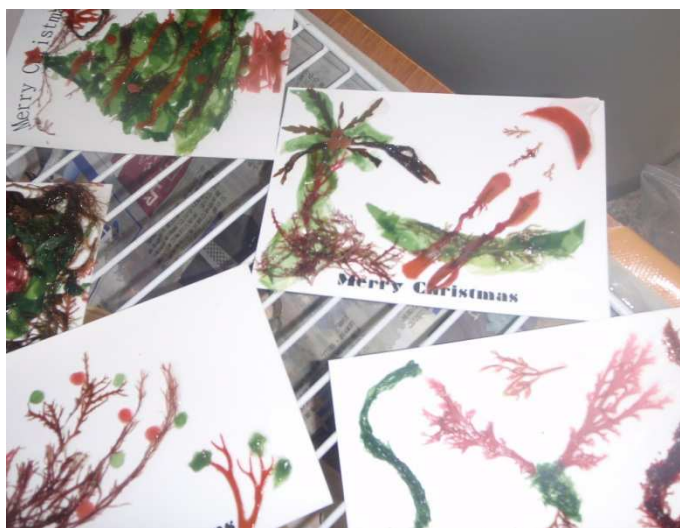
海藻で作った作品