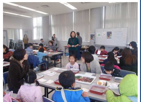
宮古開催の主旨説明