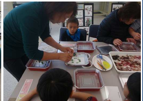
先生のお手本に見入る