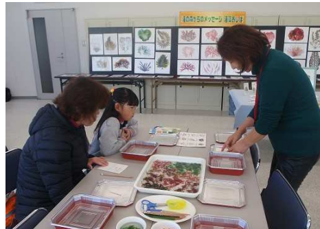
今回最初の体験者