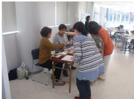
受付でハガキを選んで