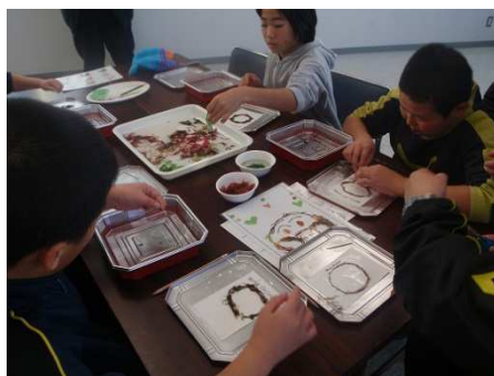
アンパンマンも出来るよ