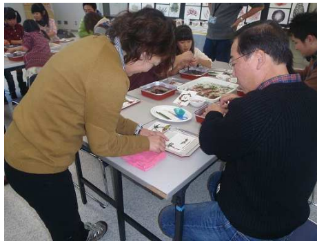
共同作業で作品作り