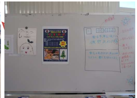
ハガキの書き方例