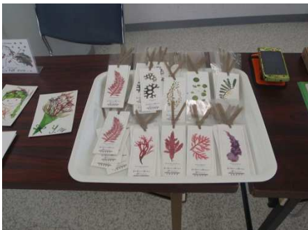
キレイなお土産のシオリ