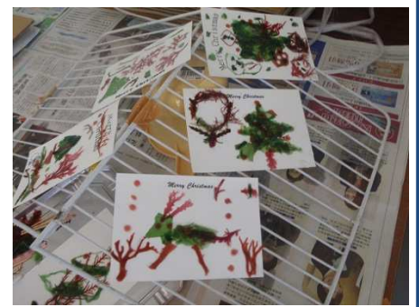
続々と素敵な作品が完成