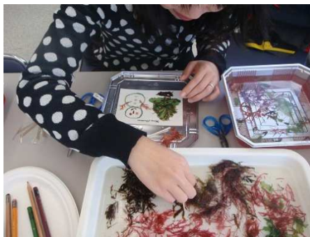
様々な海藻を使って作成