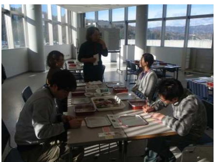
スタッフも海藻おしばに初挑戦