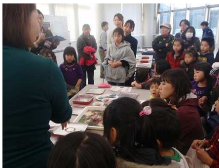
午後の部も大盛況