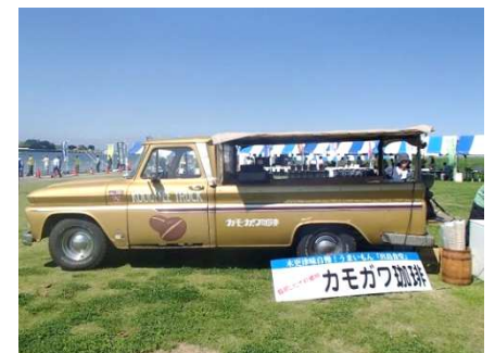
アイスコーヒーはすぐ完売した