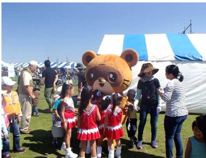
きさポンも大人気