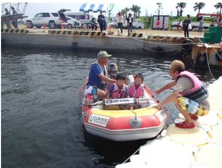
キッズボート体験乗船風景