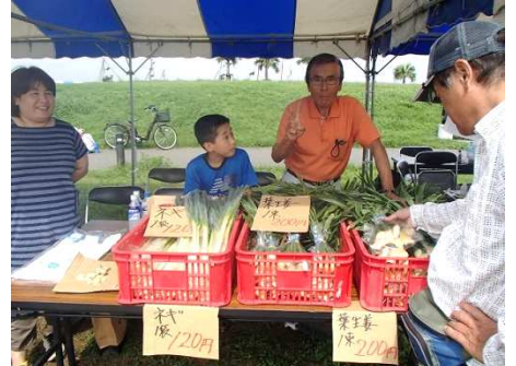
地元野菜も新鮮で安い