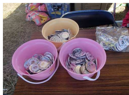
ふね検カンバッチ