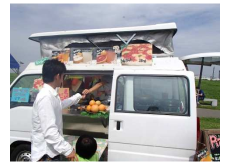
焼き立てピザの屋台車