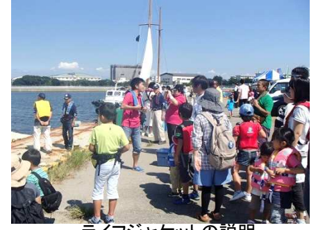
ライフジャケットの説明