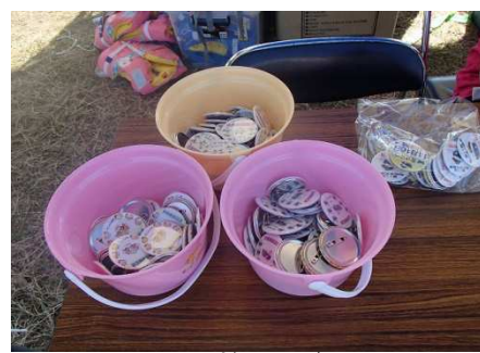
ふね検カンバッチ