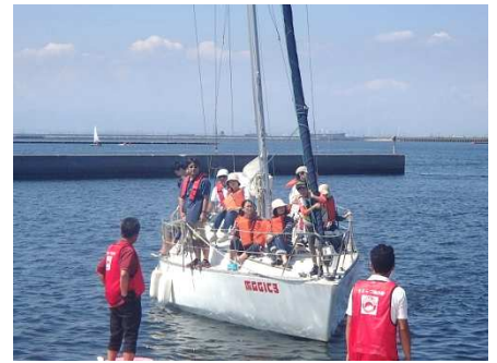
クルーザーヨット体験乗船風景