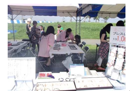
アコヤ真珠のワークショップ