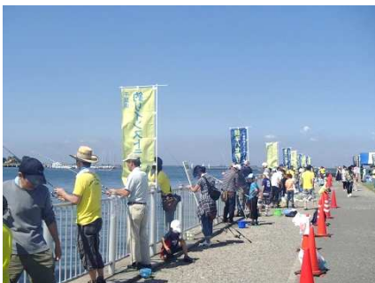
親子ハゼ釣り大会(日釣振)