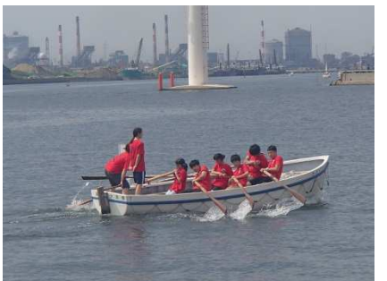
カッターレース参加者