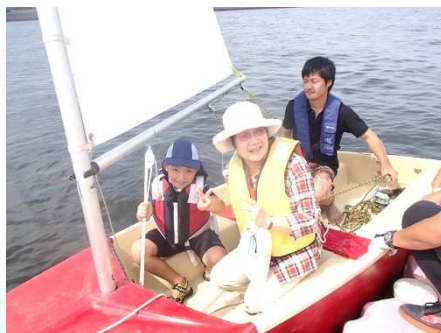
ディンギー体験乗船風景