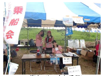
海なでしこも手伝い