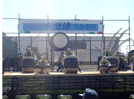
迫力のステージイベント