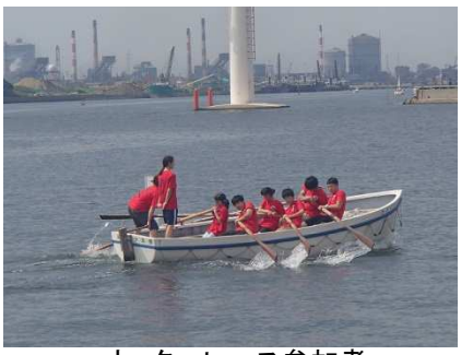
カッターレース参加者