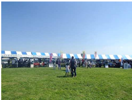
様々なブース、どこに入ろうか