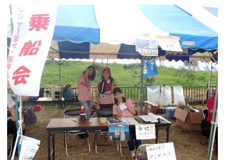
海なでしこも手伝い