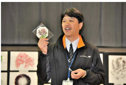
【校長先生のご挨拶】