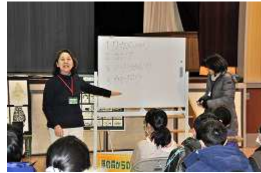
【野田先生のレクチャー】