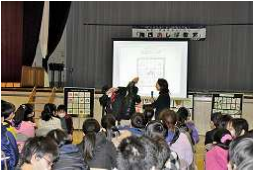
【海の森の海藻になりきる】