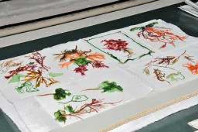
【素晴らしい作品が出来ました】