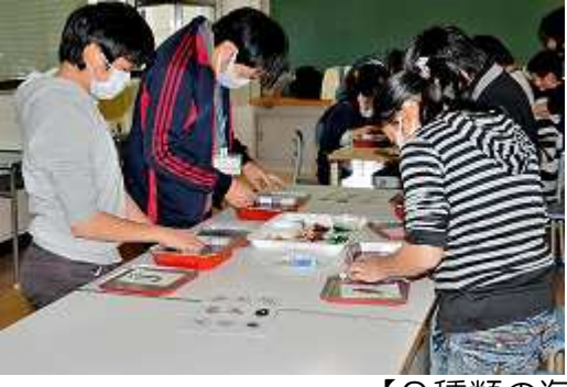
【9種類の海藻を使ってどんなおしばを作るか試行錯誤】