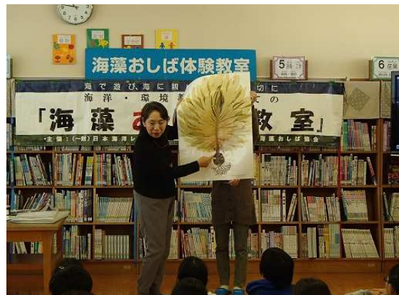
【海藻の特徴や動きの説明】