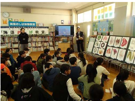
【海藻の綺麗さに驚く】