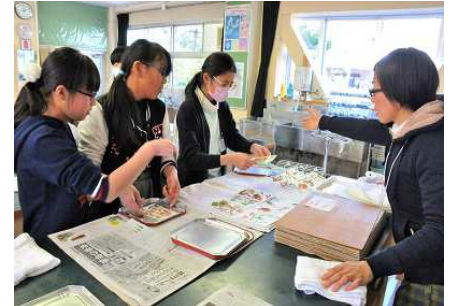
【9種類の海藻を使って～何を作ろうか】