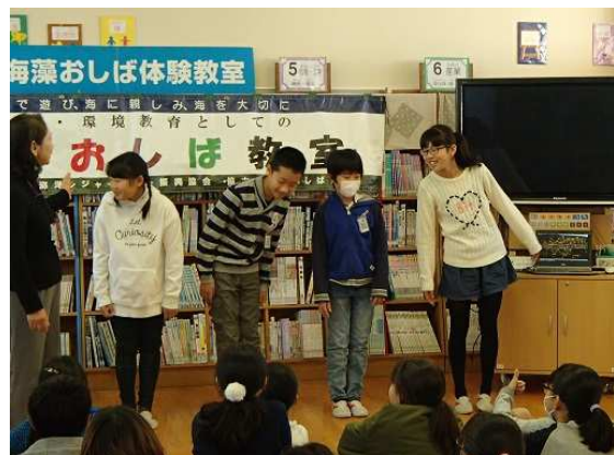
【生徒を海藻に見立てて説明】