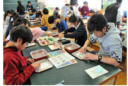
【先生も集中して作成中】